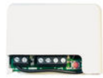
F05291 RECEPTOR RF BASIC-MINI 12-24V