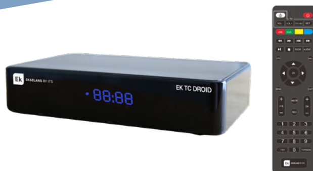
EK TC DROID