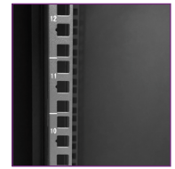
Guías "U" frontales y posteriores numeradas