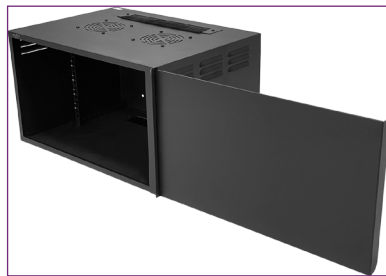
Puerta frontal metálica deslizante