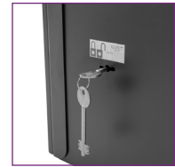
Cerradura de seguridad con llave numerada y única por rack