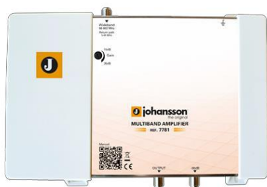
Ref. 7781 1 entrada: Cable