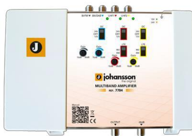
Ref. 7784 4 entradas: BI/FM, BIII/DAB, UHF1, UHF2