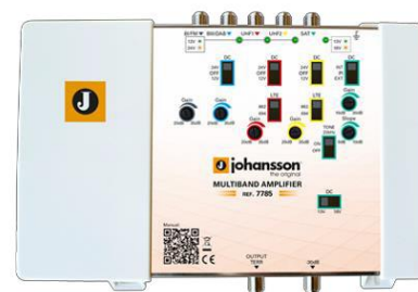
Ref. 7785 5 entradas: BI/FM, BIII/DAB, UHF1, UHF2, SAT