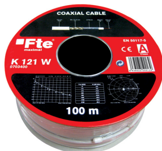
K 121 W