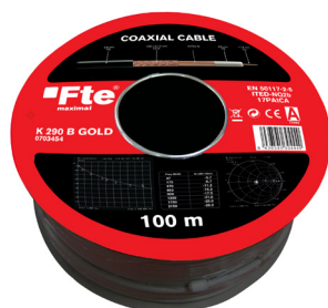
Bobina K 290 B GOLD