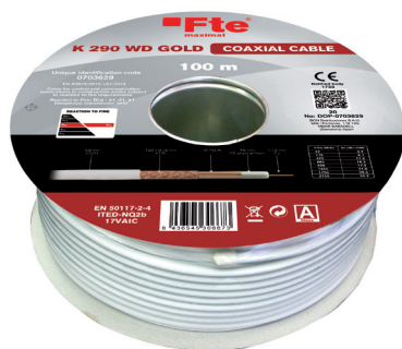
Bobina K 290 WD GOLD