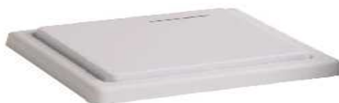
BOTON DE SALIDA A CONTROL REMOTO

El equipo YLI modelo WBK-400RC es el transmisor teledirigido sin hilos del interruptor switch para el control de acceso. Con NO / NC / COM Salida opcional del contacto. También se puede instalar en la pared fácilmente y ser controlado con sensibilidad.