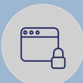
ACCESO A INTERNET SEGURO CON CLASIFICACIÓN DE INFORMACIÓN Y AUDITORÍA DE RED