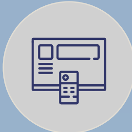
PROCESAMIENTO Y DISTRIBUCIÓN DE CANALES DE TDT, SAT E IPTV