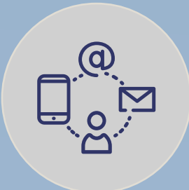
CREACIÓN DE CANALES INFORMATIVOS