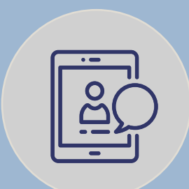
HOTSPOT. PORTALES DE BIENVENIDA. MARKETING DIGITAL.