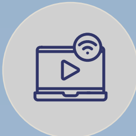
OTT - SERVICIOS DE STREAMING SOBRE WIFI