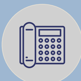
PLATAFORMA PARA DISTRIBUCIÓN DE TELEFONÍA IP