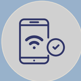
CONECTIVIDAD MÓVIL RÁPIDA Y SEGURA (BYOD)