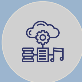
ACCESO A SERVICIOS MULTIMEDIA CON DISPOSITIVOS MÓVILES Y HOSPITALITY TV