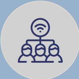
COBERTURA WIFI ESCALABLE